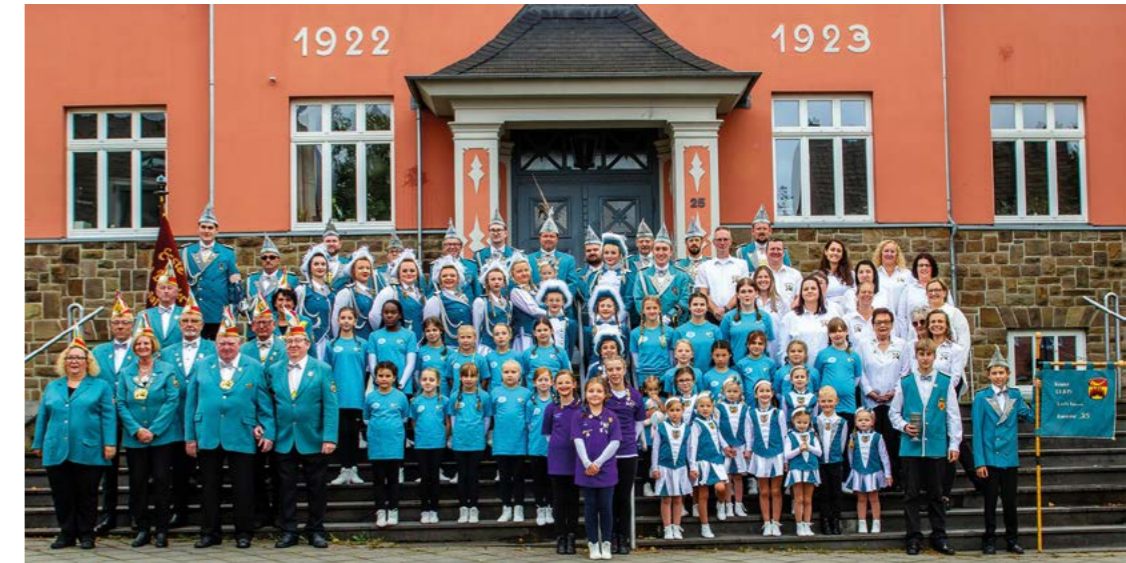
Seit 70 Jahren eine starke Truppe im Brander Karneval: Die Erste Große Brander KG.

Ferner lobt Breuer die gute Zusammenarbeit der drei Brander Karnevalsvereine EGB, Prinzengarde „Brander Stiere“ und